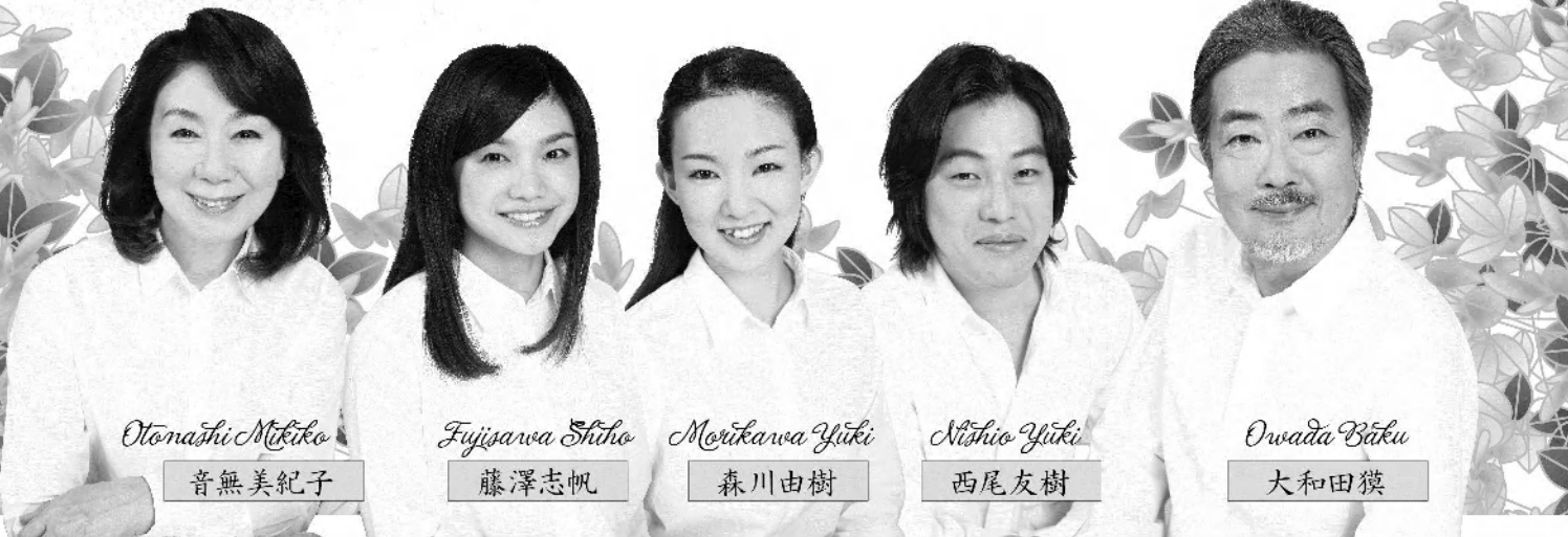
Otonashi Mikiko 音無美紀子